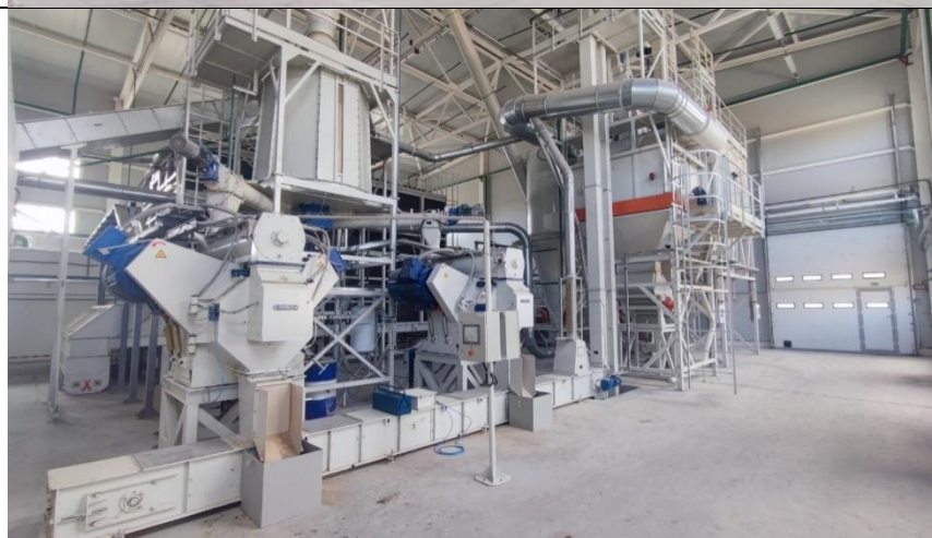
Петриковский_3_Цехпеллетно го производства Оборудование (участки гранулирования, оперативного хранения и фасовки)