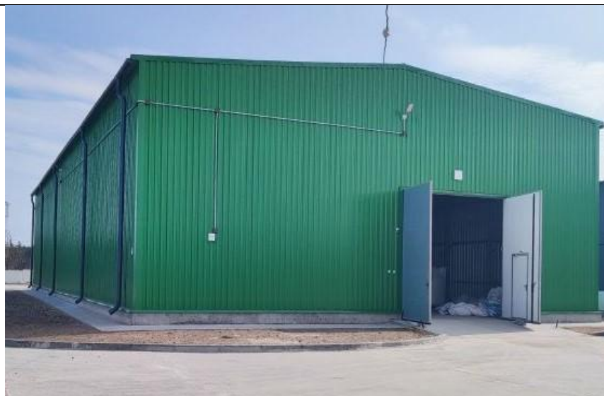
Петриковский_2_Здание склада готовой продукции