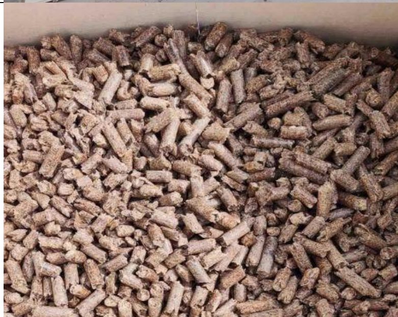
Петриковский_4_Топливные гранулы (пеллеты) Образцы выпускаемой продукции